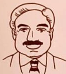
カール・シュミット